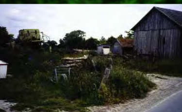
Abords de ferme délaissés

Les abords, souvent délaissés, présentent des zones où sont très vite oubliés divers objets, où sont entassés de vieux matériels. Certains bâtiments anciens ne sont pas toujours entretenus alors qu'ils constituent des éléments précieux du patrimoine rural.