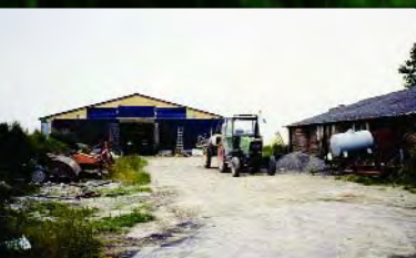
Cour en mauvais état

Les cours de ferme cumulent souvent plusieurs fonctions. Elles sont parfois encombrées et le passage des animaux et des tracteurs les dégrade chaque jour un peu plus.