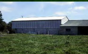
Bâtiment mal intégré au paysage

Les nouveaux bâtiments d'élevage hors-sol ou en stabulation sont souvent construits à proximité du siège d'exploitation. Leurs dimensions et leurs couleurs contrastent fortement avec le corps de ferme existant. Les silos bâchés, lestés de pneus, donnent un aspect précaire à l'espace de travail.