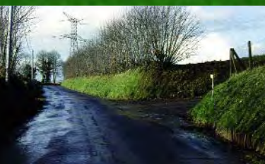
Accès mal indiqué