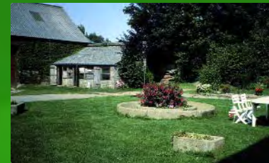
Espace d'agrément familial