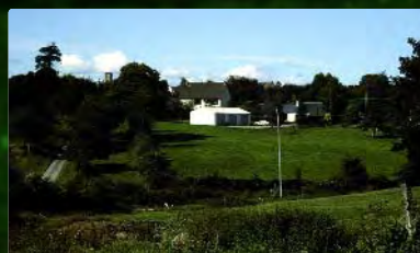
Intégration des bâtiments dans le paysage