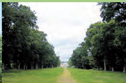
[L] Chêne pédonculé et hêtre commun

Carpinus betulus L. | Troisgots | La Chapelle-sur-Vire, le long du chemin de halage, 6 arbres plantés en alignement le long de la Vire, espacés de 6 à 32 m | h : 23 | ht : 5 à 6 | d : 60 à 110 | e : 86x17 | Les charmes marquent le chemin et créent une voûte végétale le long de la Vire. Leurs branches semblent plonger dans la rivière. Ils créent une ambiance singulière qui marque le cheminement le long de la Vire. | ****