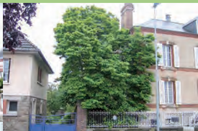
[m] Magnolia de Soulange

Quercus robur L. | 2 arbres groupés dans un jardin | La Haye-du-Puits | 50, le Gros chêne, le long d'un des axes principaux de la ville | h : 23 et 14 | ht : 4 et 3 | d : 170 et 220 | À côté des deux chênes se trouve une belle demeure dénommée "Le Gros Chêne". Elle semble avoir un lien étroit avec ces arbres. Ils sont étonnants par leurs dimensions importantes, par leur situation et leur association. Il est extraordinaire de trouver de si beaux chênes en pleine ville ! | **