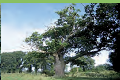
[m] Chêne pédonculé

Quercus robur L. | Bacilly | La Champagne, à l'entrée d'une ferme | Paysage bocager et peupleraies aux alentours | h: 26 | ht: 7 | d: 150 | e: 26 x 18 | dp: entre 1600 et 1700 (estimation selon le propriétaire) | Charpentières puissantes, forte poussée vers le Sud marquée par un déport de 4 m du tronc. Ancreage puissant dans le sol par d'énormes racines visibles. L'une d'entre elles mesure 80 cm de diamètre. Sa croissance déviée et sa puissance impressionnent. | ••