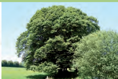
[L] Charme commun

Tilia cordata Mill. | 2 arbres groupés, espacés de 6 m | Les Loges-Marchis | Courneuve, dans l'axe de la façade de la demeure, en bord de route, arbres associés à une maison | h : 23 | ht : 1,9 et 2,6 | d : 110 et 135 | e : 17x27 | dp : 1800, selon les propriétaires (date de construction de la maison) | Les deux tilleuls marquent l'entrée de la demeure se trouvant juste derrière eux. Une plaque explique que : "Les Allemands avaient marqué ces deux tilleuls pour les abattre lors du débarquement de 1944 mais ils n'ont pu donner suite vu leurs diamètres". Ces arbres sont intéressants pour l'ensemble qu'ils créent avec la maison et l'entrée de la cour. | **