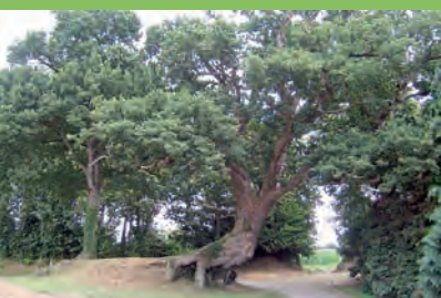
[m] Chêne pédonculé

Fagus sylvatica 'Pendula' Loud. | Saint-Romphaire | RD 251, Le Couespel, dans le jardin d'une propriété bordé sur deux côtés par une allée plantée de tilleuls | h: 14 | ht: 4,6 | d: 70 | e: 20 x 16 | L'arbre, tortueux, se développe sur un axe Est/Ouest. Cette ancienne ferme appartenait à M. Guérard (maire de Saint-Romphaire entre 1866 et 1909), frère de l'Évêque de Coutances et d'Avranches. Ce dernier y venait apparemment en repos dominical. L'allée de tilleuls plantée, longue de 125 m, sous la forme d'un déambulatoire, offrait un oratoire en son centre. Ce hêtre est impressionnant par ses dimensions et son étalement. Son réseau de branches tortueuses lui donne une allure étonnante. | •