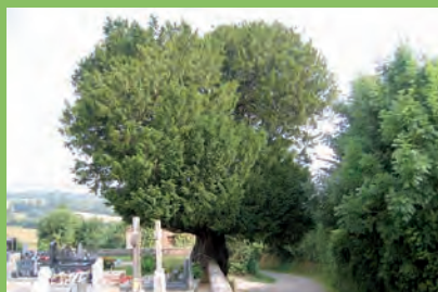
[m] If commun

Taxus baccata L. | Teurthéville-Bocage | Cimetière | h: 18 côté route et 16,50 dans le clos de l'église | ht: 1,1 dans le clos de l'église | d: 180 | e: 13 | L'if est taillé en table à 2 m de haut environ. Il s'encastre dans le mur du cimetière. L'écorce et le mur, recouverts de lichen, se distinguent à peine l'un de l'autre. La vue sur l'arbre encadré dans le mur d'enceinte est particulièrement insolite depuis la route. | •••