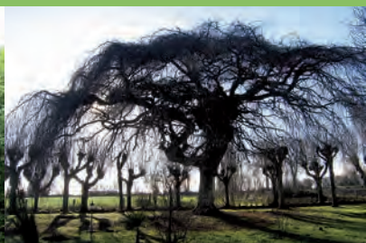
[m] Hêtre pleureur

Taxus baccata L. | Teurthéville-Bocage | Cimetière | h: 18 côté route et 16,50 dans le clos de l'église | ht: 1,1 dans le clos de l'église | d: 180 | e: 13 | L'if est taillé en table à 2 m de haut environ. Il s'encastre dans le mur du cimetière. L'écorce et le mur, recouverts de lichen, se distinguent à peine l'un de l'autre. La vue sur l'arbre encadré dans le mur d'enceinte est particulièrement insolite depuis la route. | •••