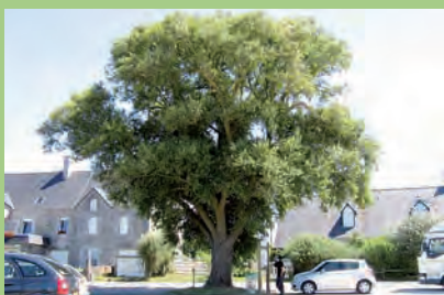
[L] Saule fragîle

Magnolia X soulangeana Soul. Bocl. | Coutances | 2 rue des Teintures, entre les 2 pignons et un mur de 1,80 m de haut | h : 13 | d : 80 | e : (6+7)x8 | dp : Entre 1860 et 1870, selon le propriétaire (date à laquelle la maison fut construite) | Cette cépée de trois branches s'élève entre les constructions. Ce magnolia est époustouflant par sa floraison et sa situation entre deux maisons de ville. À la belle saison, il apporte une touche de verdure singulière dans cet espace minéral. | **