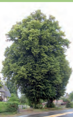
[L] Tilleul à petites feuilles

Ces arbres entretiennent des liens intimes avec les paysages qui les accueillent. S'ils ne sont pas remarquables individuellement, leur rapport à l'habitat, à leur milieu ou l'ensemble qu'ils forment avec leurs congénères en font des éléments structurants du paysage. Points de repère dans l'espace rural, points d'appel dans les paysages urbains, ensemble de deux individus ou d'une centaine, faire-valoir, ou eux-mêmes objets de toutes les attentions, ils sont indissociables des sites qui les ont vu grandir.