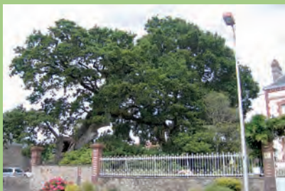
[m] Chêne pédonculé

Quercus robur L. et Fagus sylvatica L. | Prétot-Sainte-Suzanne | Le Château | h : 24 à 28 | ht : 1 en moyenne | d : 30 à 110 pour les chênes ; 20 à 95 pour les hêtres | e : environ 800 m de long | dp : 1829 et 1830 | 424 arbres dont 378 chênes et 46 hêtres espacés de 3 à 3,50 m ont été plantés sur deux hivers par le comte de Choiseul. Cette double allée est impressionnante en raison de la perspective qu'elle crée sur le château et le bocage. Sa densité et sa régularité lui donnent un caractère imposant. | **